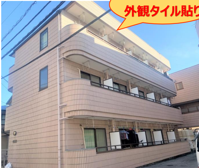
※写真はイメージです(別室の物になります。)